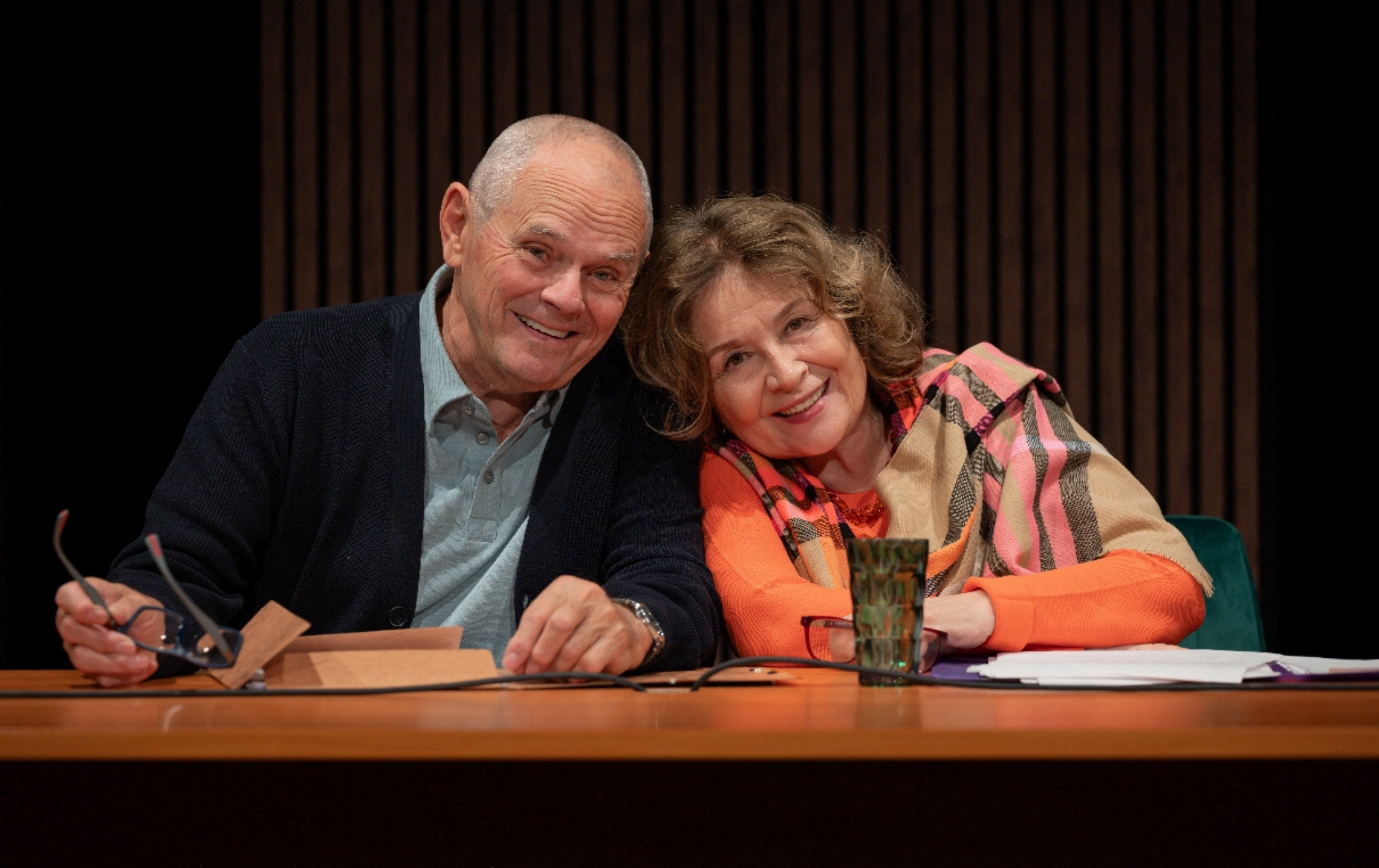
Milostné dopisy ( STUDIO DVA Malá scéna )