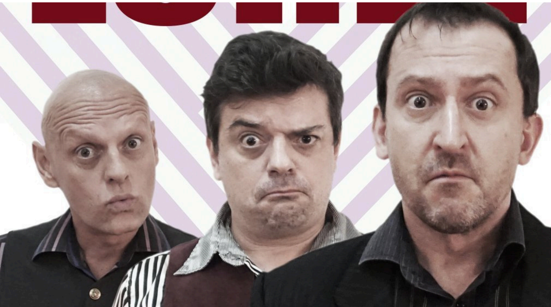
Lordi ( Švandovo divadlo )