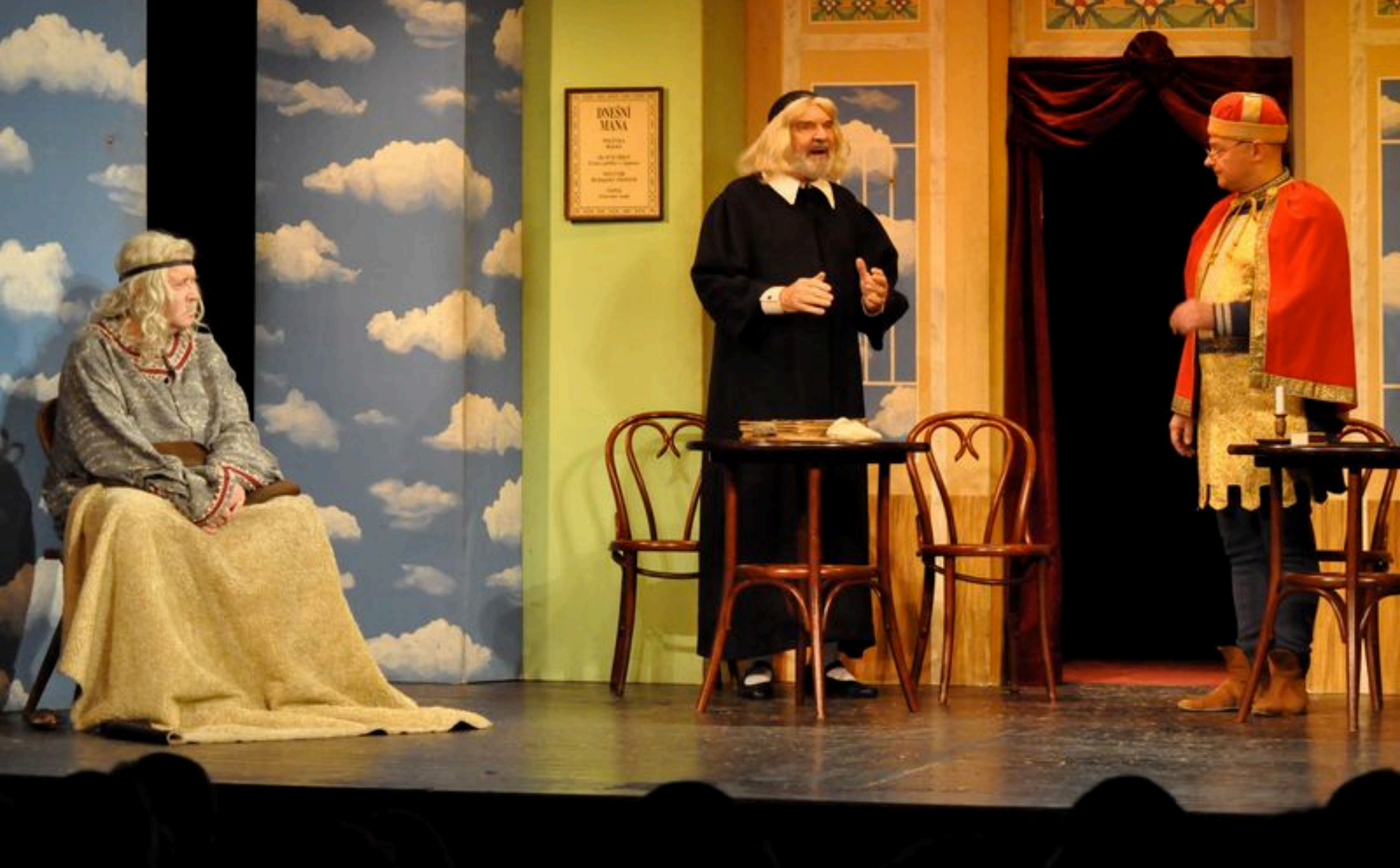
České nebe (Žižkovské divadlo Jára Cimrmana)