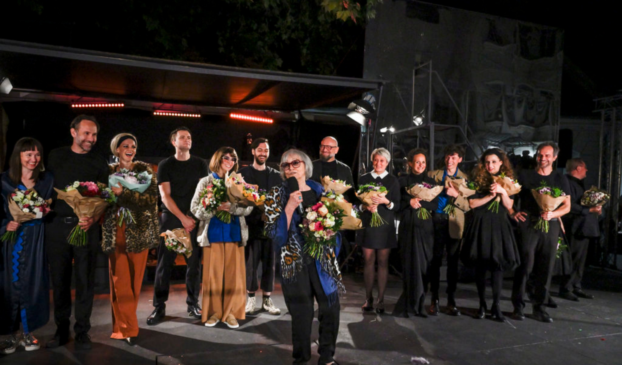
Marta ( Letní scéna Musea Kampa )