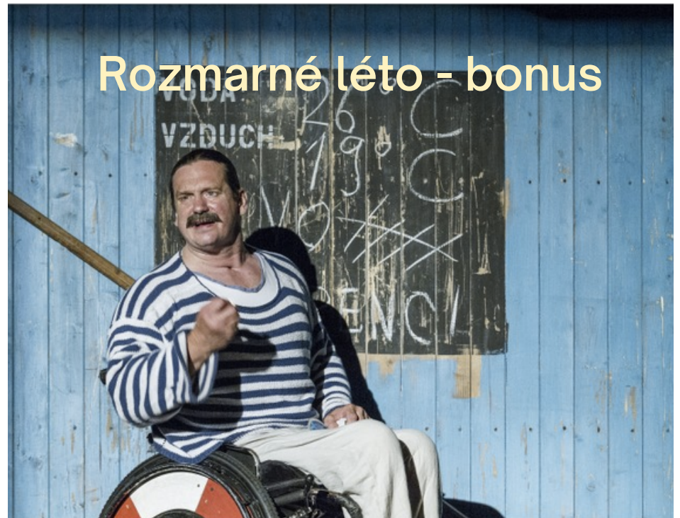
Rozmarné léto - bonus