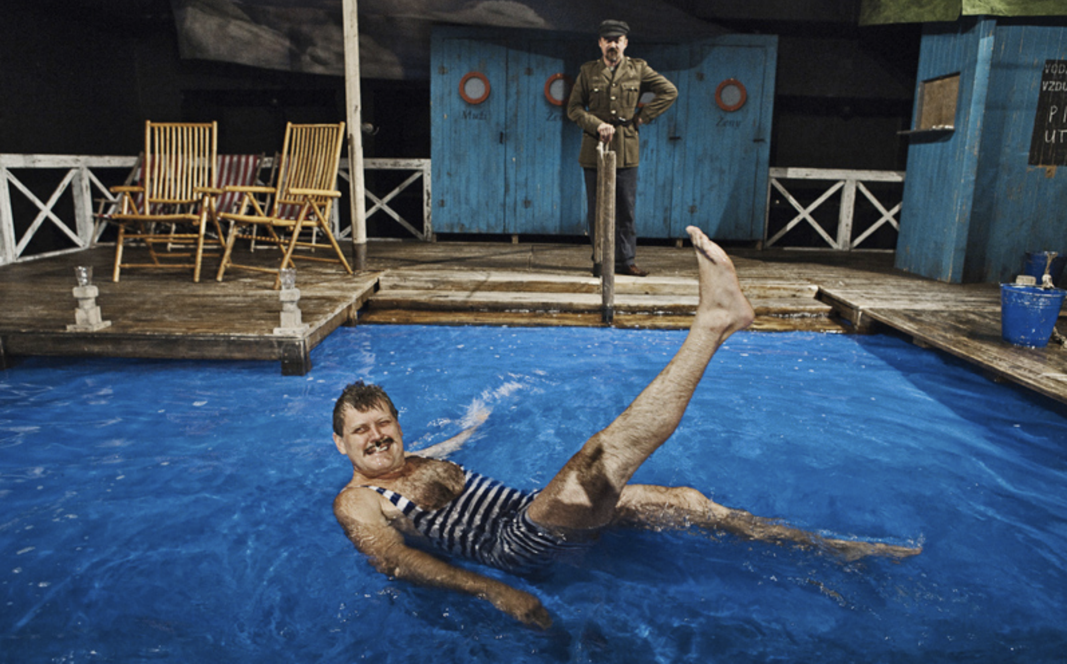
Rozmarné léto (Divadlo v Celetné)