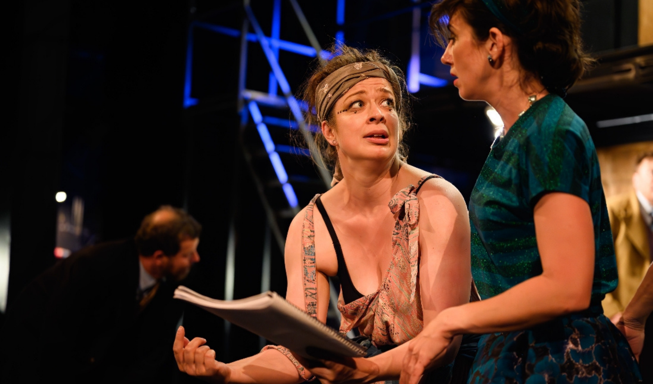
Bez roucha ( Studio DVA na Vyšehradě )