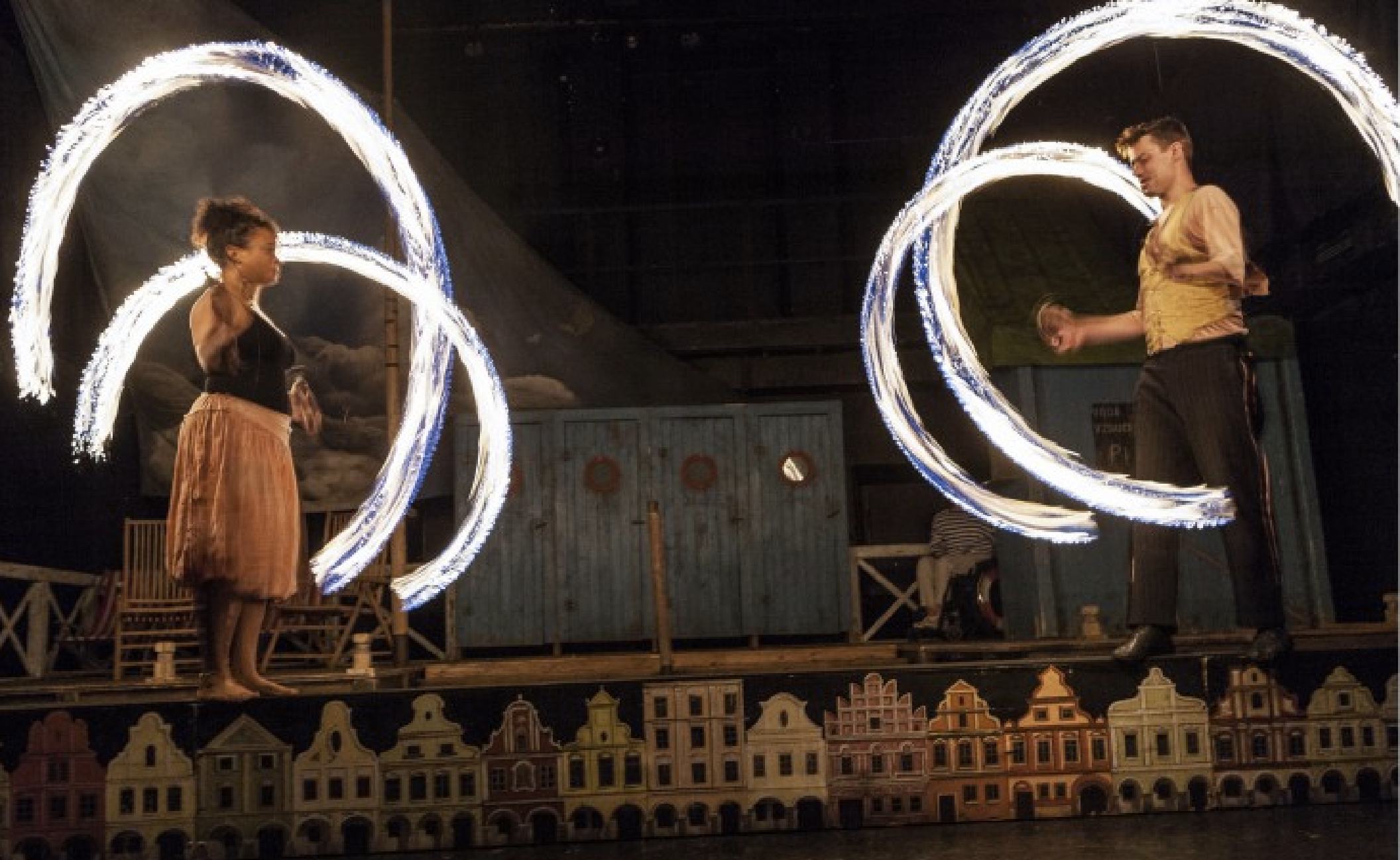
Rozmarné léto - bonus (Divadlo v Celetné)