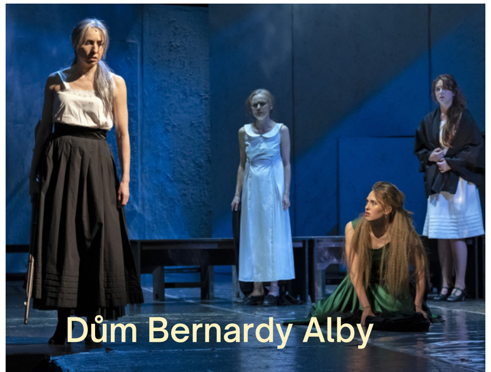
Dům Bernardy Alby