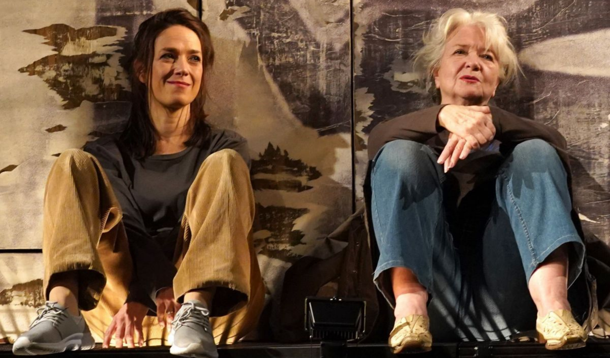
Na útěku ( Komorní divadlo Kalich )