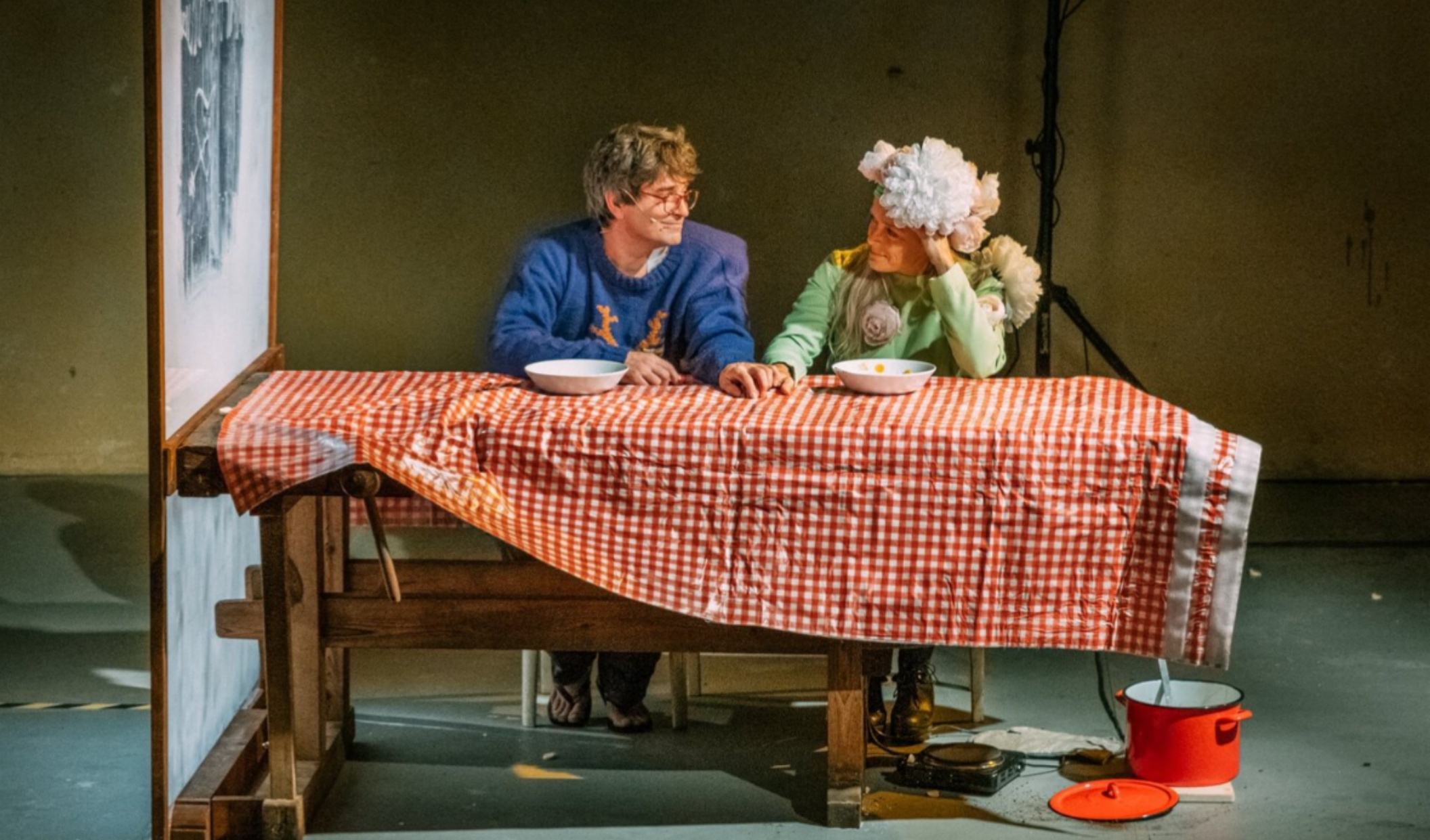
Zahradníček / Vše mé je tvé ( JEDL )