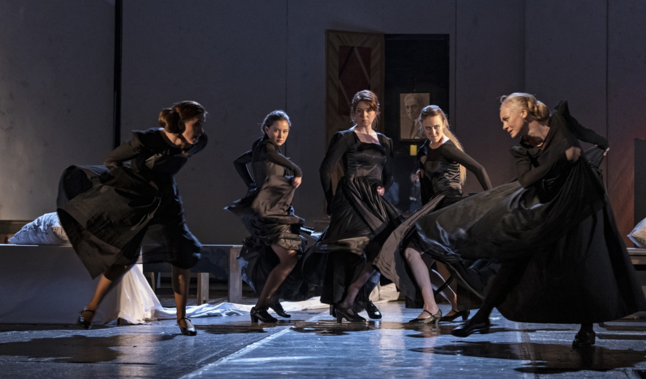
Dům Bernardy Alby ( Divadlo na Vinohradech )