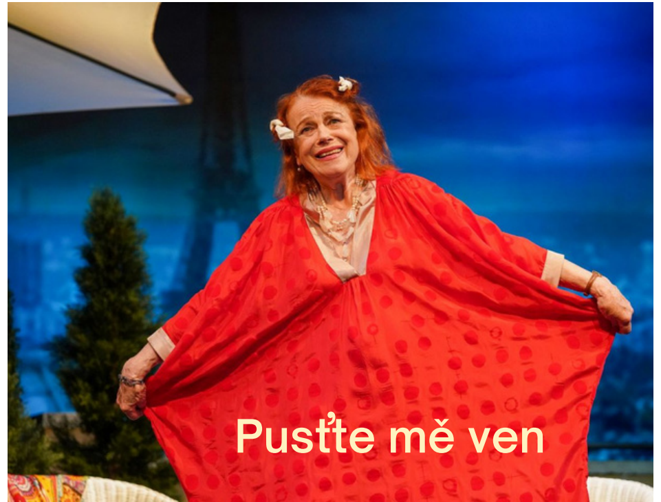
Pust'te mě ven