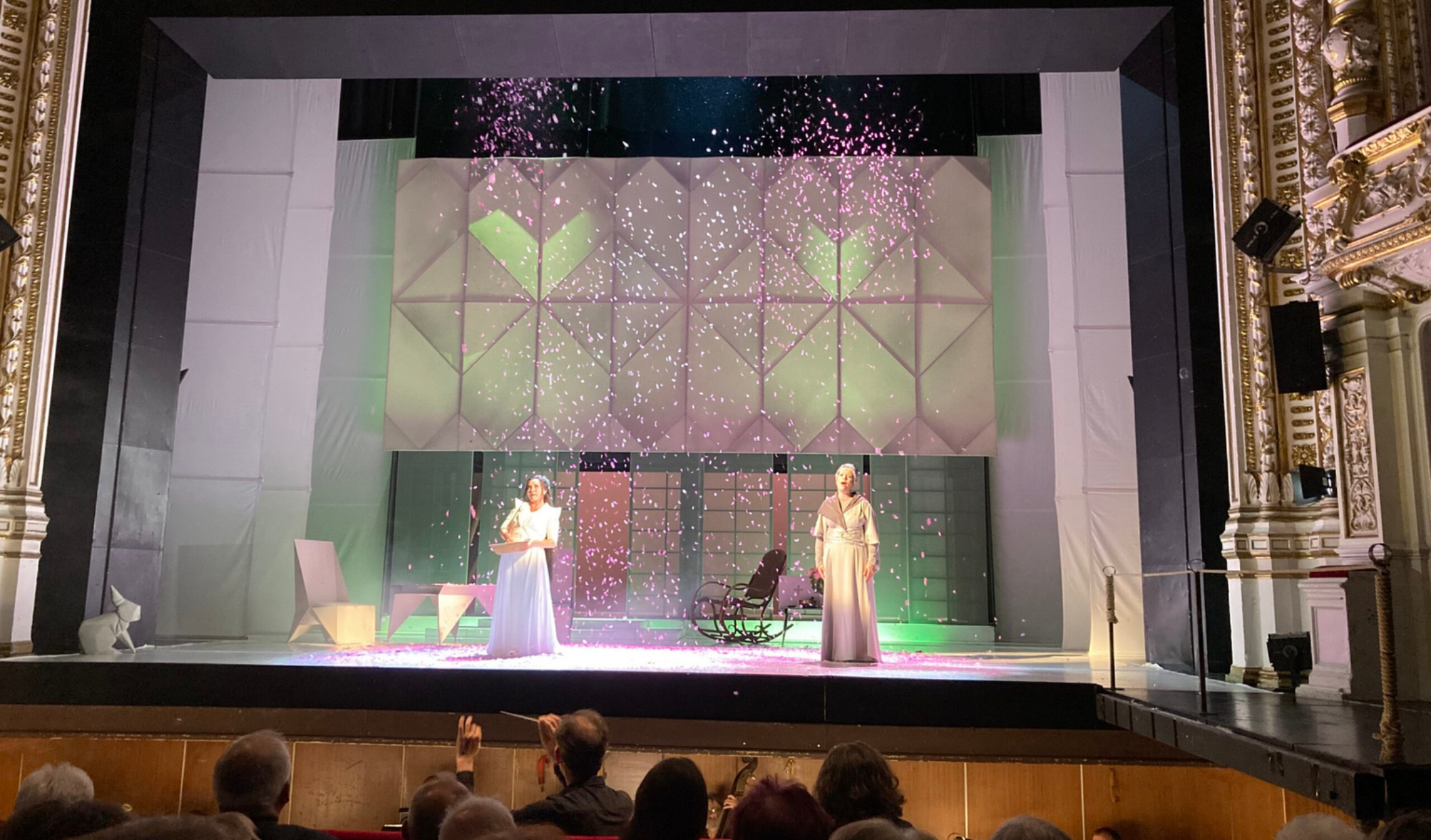
Šaldova šňůra 2023 (Divadlo F.X.Šaldy)