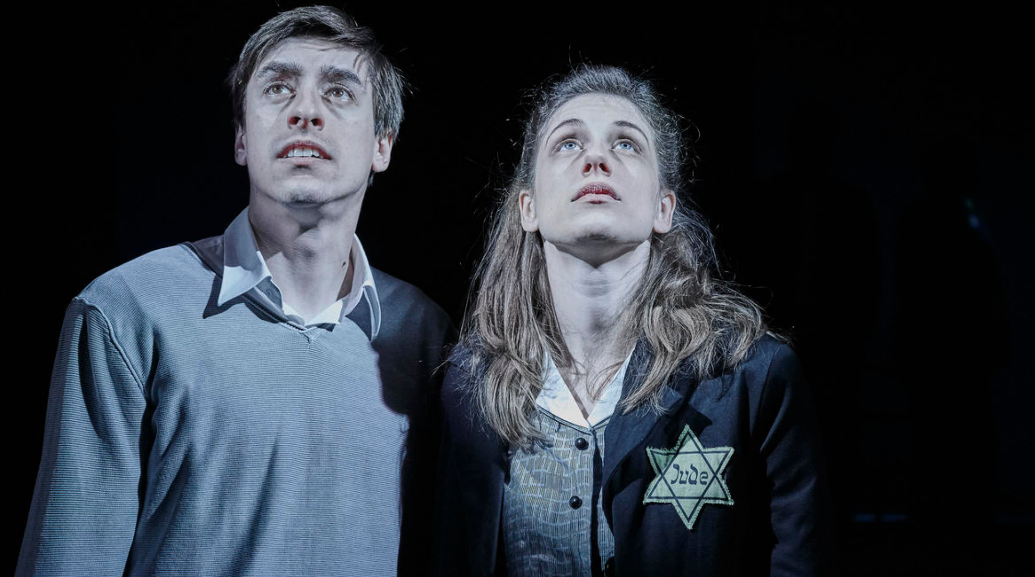
Romeo, Julie a tma (Divadlo v Dlouhé)