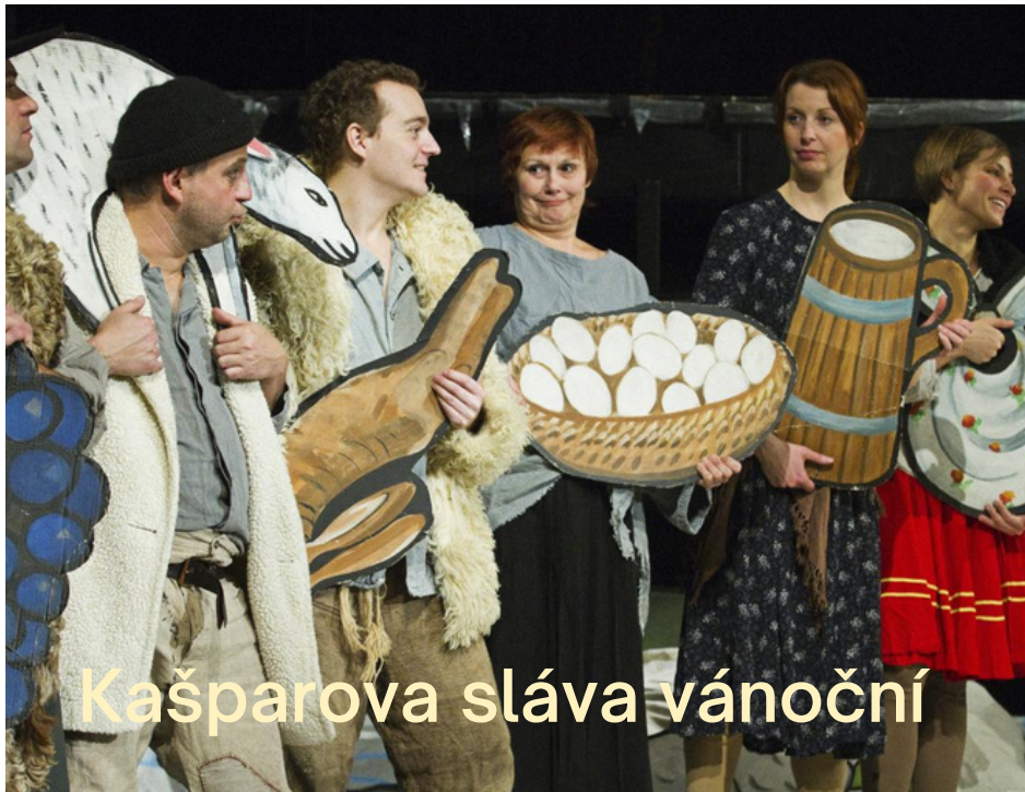
Kašparova sláva vánoční