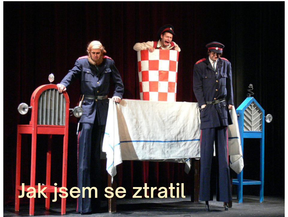
Jak jsem se ztratil